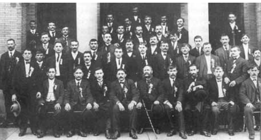
Четврта конвенција Српског народног савеза 1905.

учине на побољшању односа Срба у расејању и у домовини. Доделићемо и три награде: новчана стипендија студенту постдипломцу у износу од 3.500 америчких долара, новчана стипендија студенту на основним студијама у износу од 2.500 аме- ричких долара, и новчана стипен- дија ученику у средњој школи у из- носу од 2.500 америчких долара. За свакога су обезбеђени и производи у вредности од по 500 америчких долара.