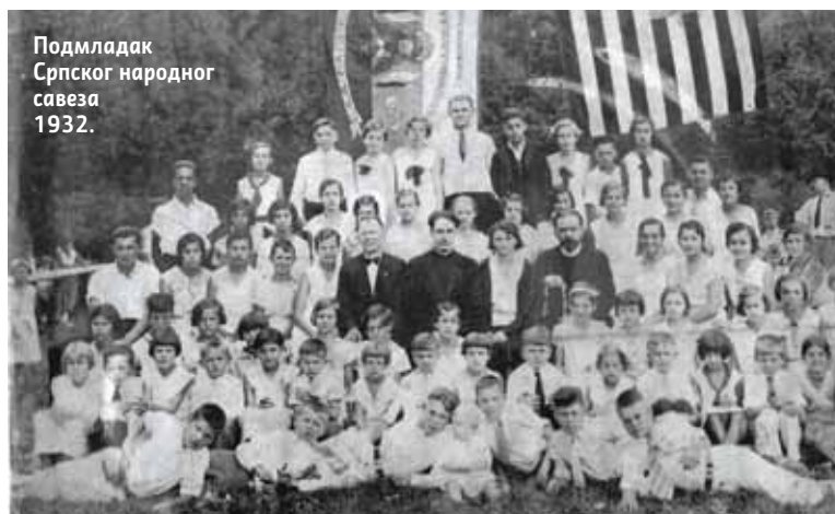
Подмладак Српског народног савеза 1932.