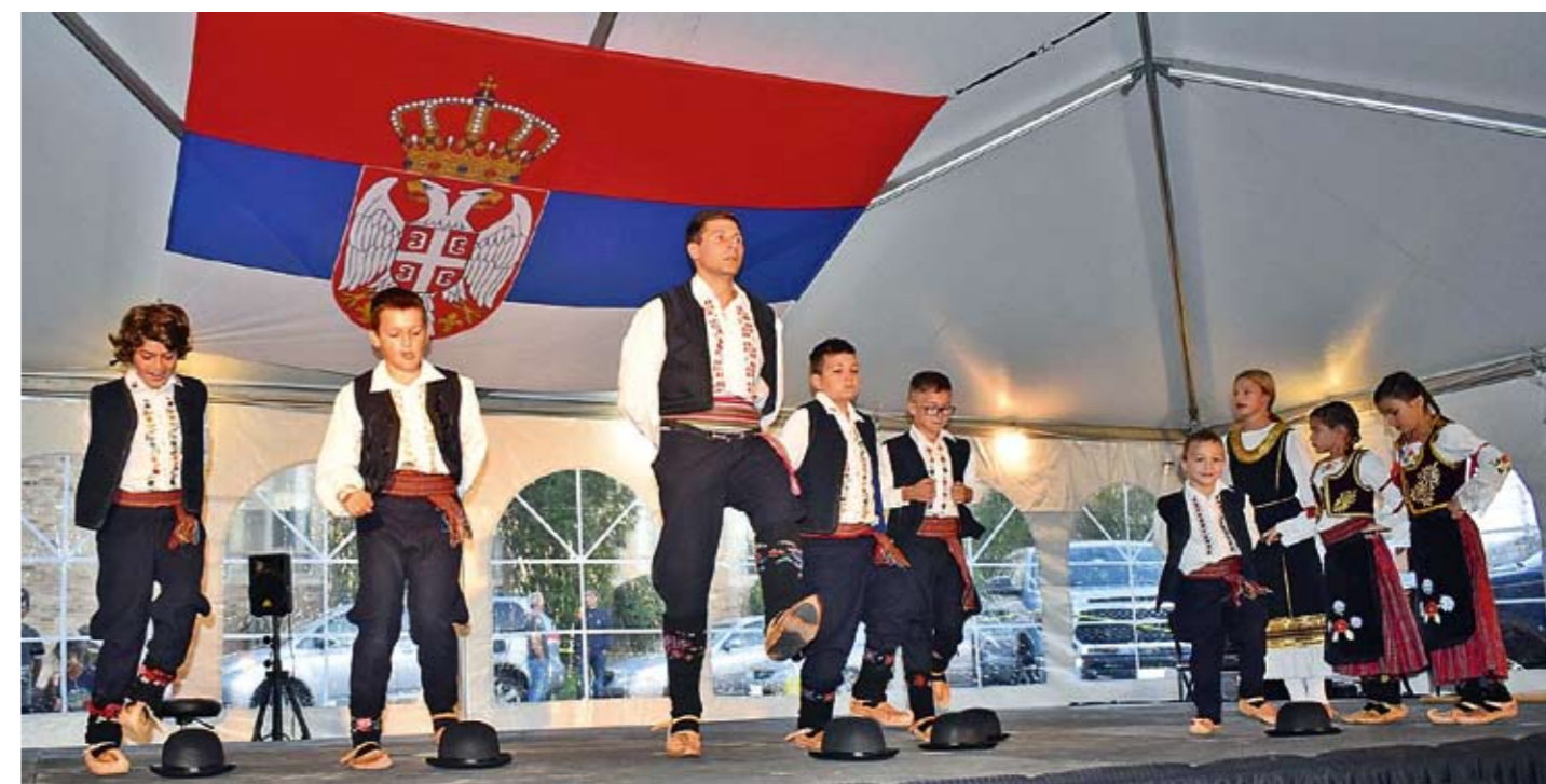
Наступ Српског фолклорног друштва „Грчаница“ из Бостона

И госте и учеснике носила је невероватна енергија, ентузијазам људи који желе да помогну својој цркви и промовишу своју традицију и наслеђе. Међу волонтерима било је пуно младих и високообразованих америчких Срба. Било је невероватно много деце – ни у једној