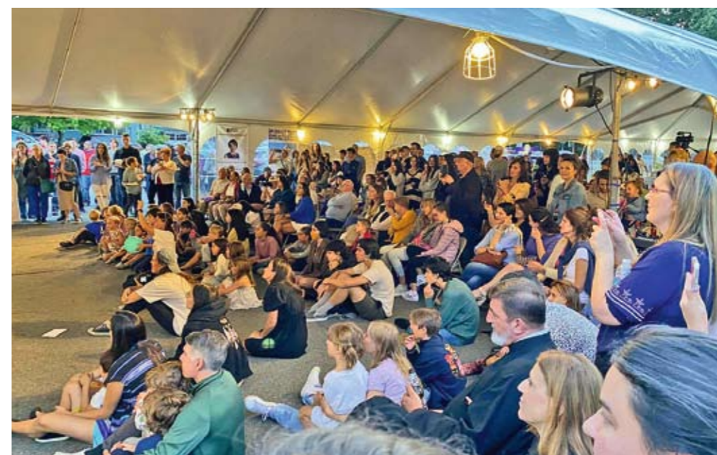
Ни у једној српско-америчкој заједници у САД није виђено толико деце у току једног окупљања као што је то било у Бостону

У бостонској луци укотвљен је најстарији брод америчке морнарице. Иако направљен од дрвета, добио је назив „Стари гвоздени бок” да би показао снагу и независност нове америчке државе. Први пут испловио је 1797. године, задатак му је био да заштити америчке трговачке бродове током такозваног квазирата с Французима, од пирата, као и током рата 1812. против Британске империје. Данас се брод користи за туристичке посете, јавне догађаје, церемоније, образовање младих и за представљање историје америчке морнарице и још увек пливи океаном.