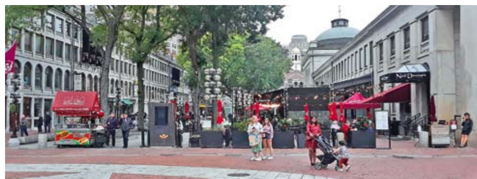
Шеталиште за туристе око Фуњуел зграде

Старе грађевине, симболи Бостона и настанка Америке данас делују необично и усањено међу многобројним пословним небодерима. Једна од традиционалних грађевина је Стара државна кућа (Old State House), изграђена 1713. године. Испред ове зграде догодио се тзв. крвави масакр у марту 1770. године када су британски војници убили пет људи и многе ранили. Шест година касније испред ове зграде прочитана је Декларација независности. Данас је у овом здању смештен музеј историје Бостона и Америке. С леве и десне стране балкона, на предњој страни зграде, налазе се статуе лава и једнороге митске животиње као краљевски симболи Велике Британије.