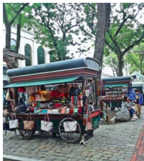
Тезге са сувенирима

српско-америчкој заједници у САД није виђено толико деце у току једног окупљања као што је то било у Бостону. Ова чињеница улива наду у светлу будућност српско-америчке заједнице.