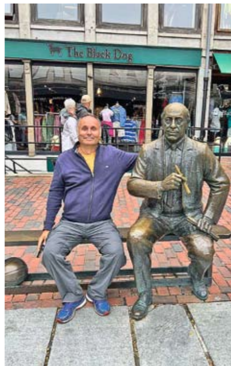
Наш репортер поред статуе Рида Аурбаха, легендарног тренера Бостон Селтикса