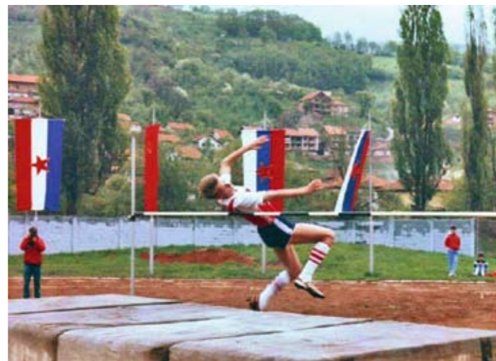
У младости је био активан спортиста

Драгољуб Стевановић Фотографије лична архива